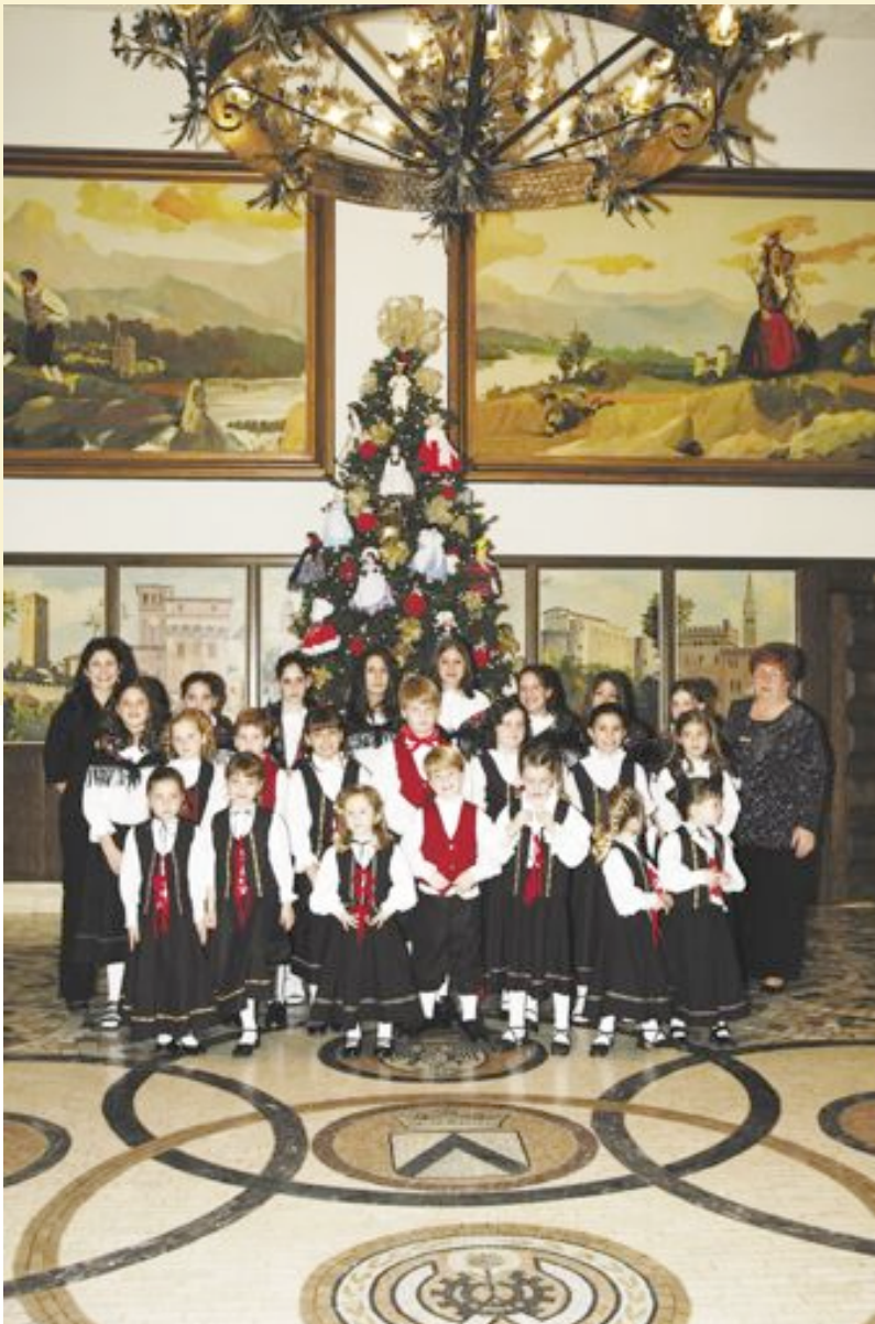
The Children's Choir at the Christmas Banquet.

With the winter slowly fading into a memory, the club is working on several events to bring in the Spring and Summer season. Upcoming events include Mother's Day Dinner, Spring Members' Banquet, Father's Day Mass and Picnic, Annual Golf Tournament, and many other events.