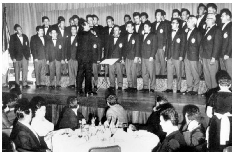
Il Coro di Santa Cecilia (1967).