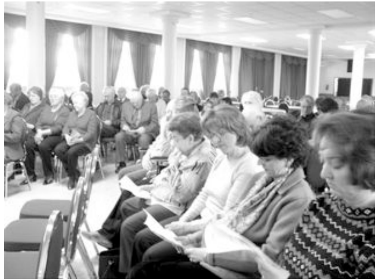
Ottawa - Membri e simpatizzanti alla Fieste dal Popul Furlan .

Una gran parte del direttivo è già da ora inserito nelle preparazioni per il Congresso "Fogolârs 2006".