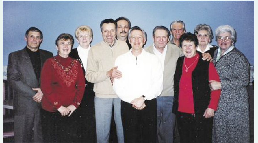
Il direttivo del Fogolâr Furlan della Niagara Penisola - 2004.

Anche quest'anno il Fogolâr Furlan della penisola del Niagara si dà da fare per organizzare progetti interessanti, cercando sempre di migliorare il "carnet" per la comunità friulana della zona.