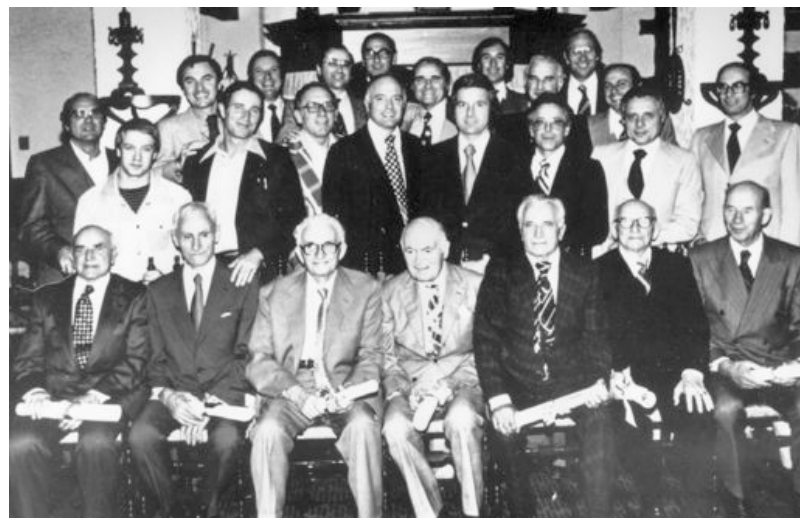
First Generation and Sons (1975).