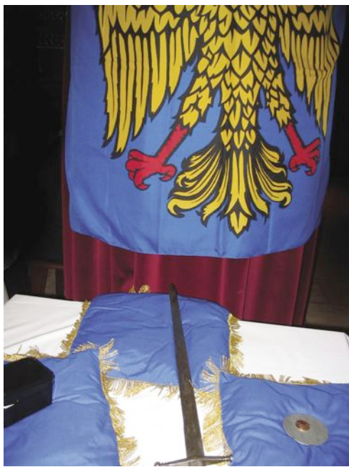
Tre significanti realtà della nostra storia: la bandiera del Friuli Patriarcale, la spada, il tallero e un pugno di terra della Piccola Patria alla Fieste dal Popul Furlan a Montreal.