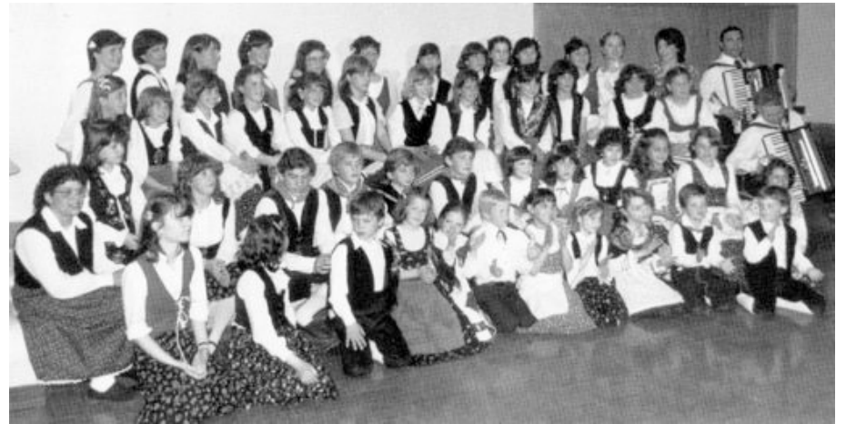
The Famée's Ballerins in Traditional Costume (1980).

Per il cinquantenario di fondazione del Sodalizio (anno 1982) viene presentato un pregiato volume sulla storia della Famée, illustrato da preziose fotografie.